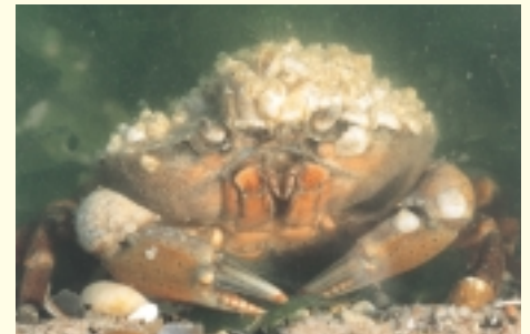
Krab begroeid met zeepokken

zandbanken aanwezig. Ze vormen vaak ware onderwatermu- ren, die – op één uitzondering na, de Broersbank t.h.v. Koksijde – net niet droog komen te liggen bij extreem laagtij. De grote hoeveelheid bodemorganismen die op deze zandbanken leven vormen een belangrijke voedselbron voor zee-eenden en voor vele vissoorten . Deze laatste zijn op hun beurt van groot belang als voedsel voor weer andere zeevogels . Daarnaast fungeren de zandbanken uitstekend als kraamkamer voor vele vissoorten en ongewervelden.